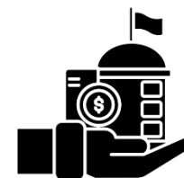
政府捐助之 財團法人