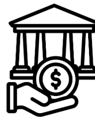
受政府控制之 事業、團體或機構