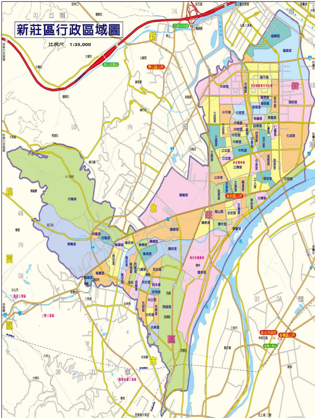
圖一 新北市新莊區行政區域圖