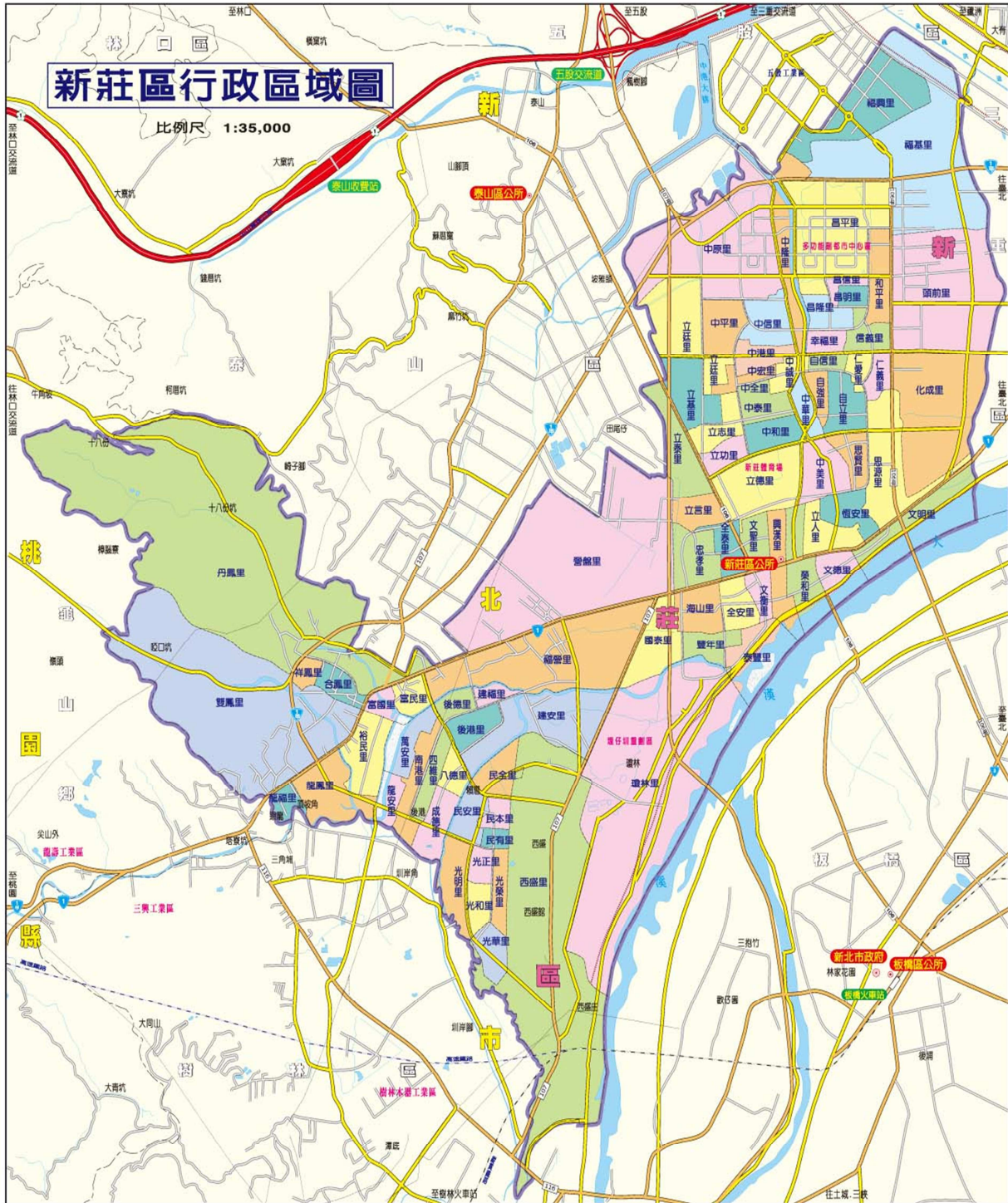
圖一 新北市新莊區行政區域圖