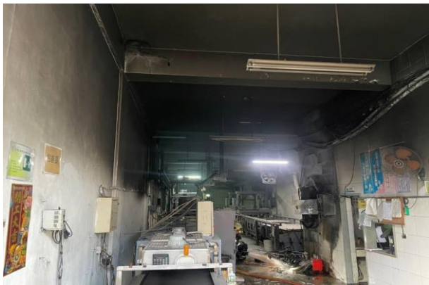
說明：本案主要燒損停放於該址作業區內之電動自行車。