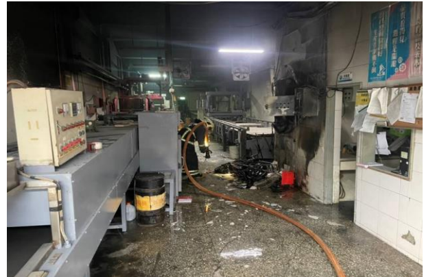
說明：本案火災現場主要燒損停放於該址作業區內之電動自行車。