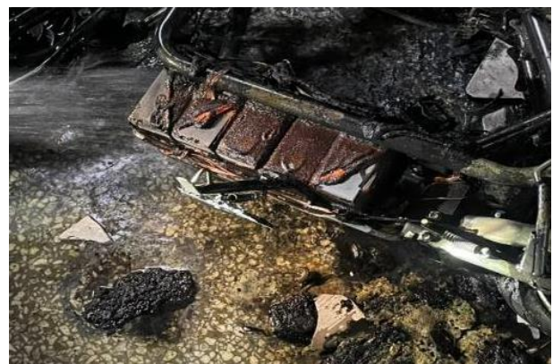
說明：檢視該車燒燬僅殘餘骨架，鋰電池有劇烈氧化變色情形。