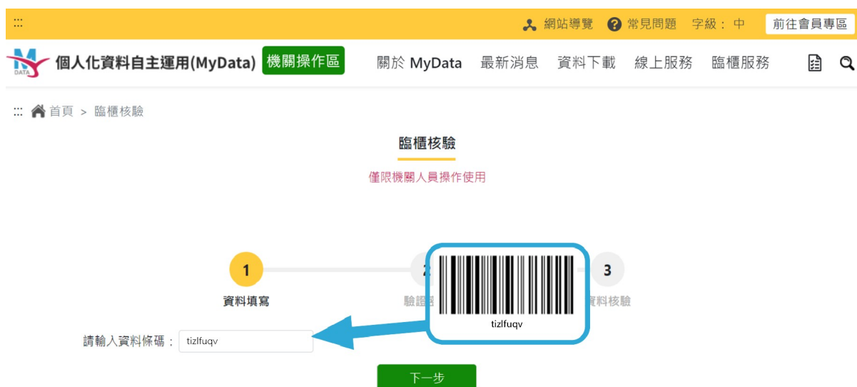
圖 13、MyData 服務平臺_臨櫃核驗頁面