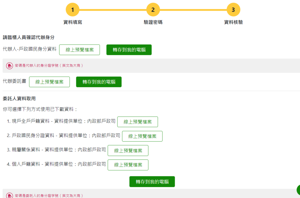
圖 15、MyData 服務平臺_取得個人資料檔案