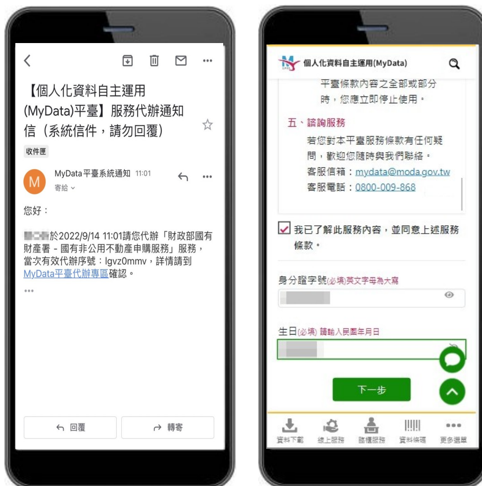
圖 9、MyData 服務平臺_通知代辦人並連結進入 MyData 平臺

九、代辦人收到「委託代辦通知」簡訊或信件後，請點擊通知內的連結進入MyData平臺。臨櫃核驗為確認代辦人身分，需下載「戶政國民身分證資料」，代辦人須輸入身分證字號及生日，並點選下一步進行身分驗證。