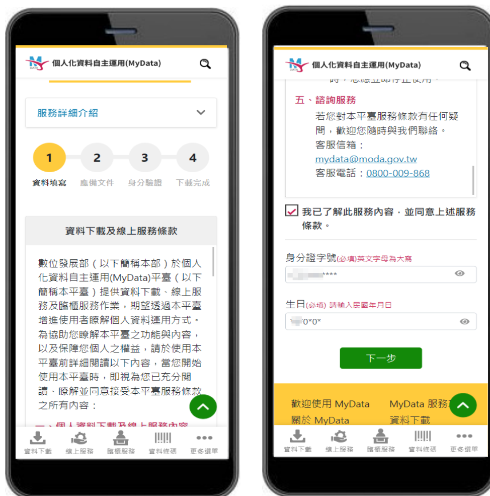
圖 3、MyData 服務平臺_同意服務條款、輸入個人資料

三、同意 MyData 服務條款，並輸入身分證字號及生日，輸入完畢後點選下一步。