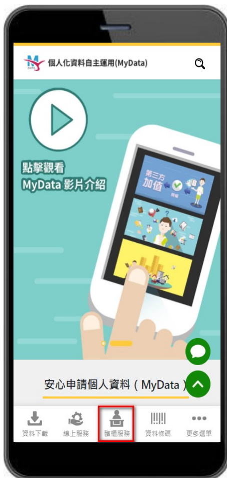
圖 1、MyData 服務平臺_點選臨櫃服務