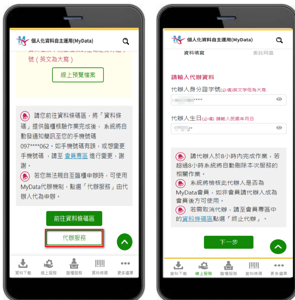
圖 7、MyData 服務平臺_下載完成點選代辦服務並輸入代辦人資訊

七、驗證通過並待取用資料下載完成後，點選「代辦服務」並輸入代辦人身分證字號及民國出生年月日。代辦人必須先成為 MyData 會員，方能使用此服務