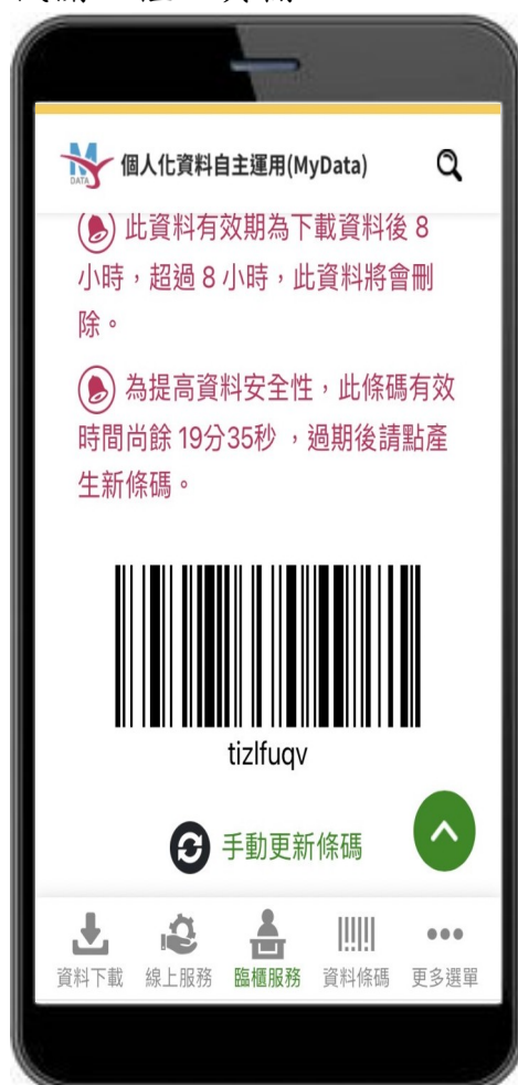
圖 12、MyData 服務平臺_資料條碼區