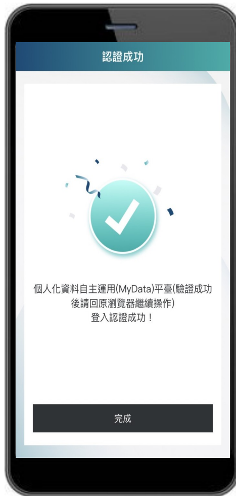
圖 6、MyData 服務平臺_驗證完成