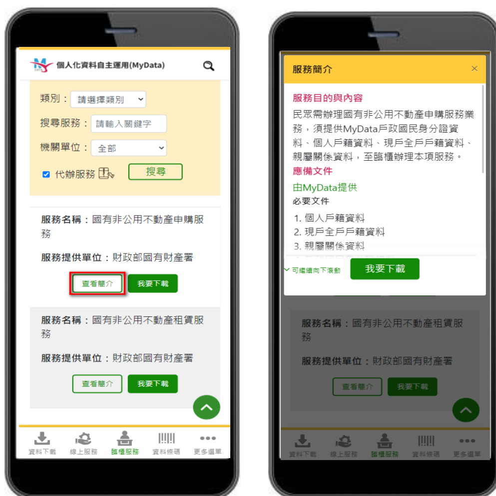
圖 2、MyData 服務平臺_選擇有代辦服務的臨櫃項目