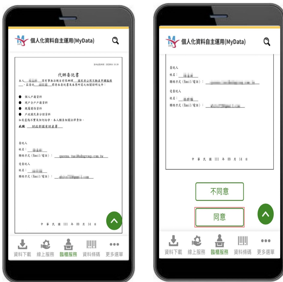
圖 11、MyData 服務平臺_代辦人同意委託辦理