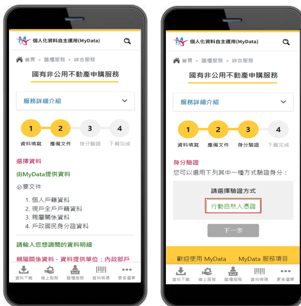
圖 4、MyData 服務平臺_確認應備文件、進行身分驗證