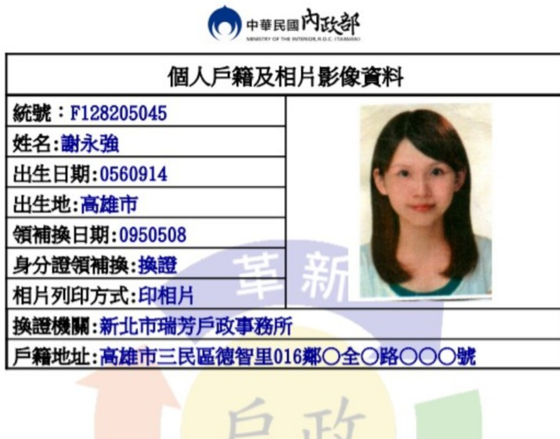
圖 16、MyData 服務平臺_資料取得