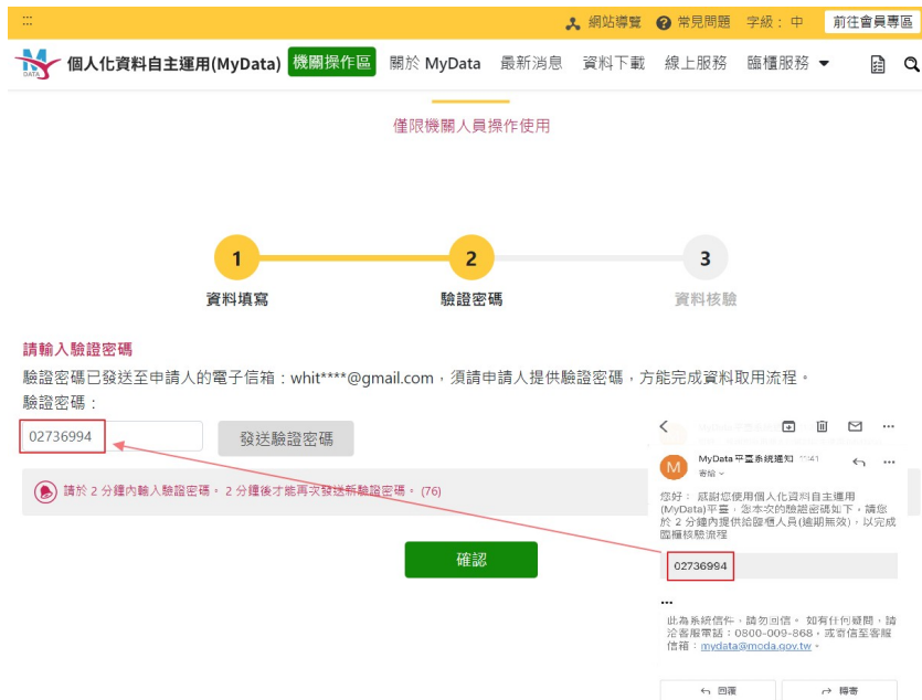
圖 14、MyData 服務平臺_驗證密碼輸入