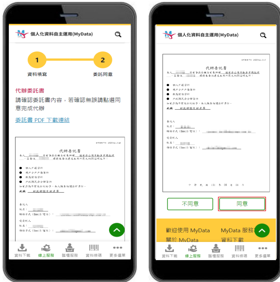
圖 8、MyData 服務平臺_同意代辦即完成委託

八、檢視代辦委託書資料是否正確，並可點選連結進行委託書下載，前述動作完成後，按下「同意」代辦人進行服務申請，即完成委託